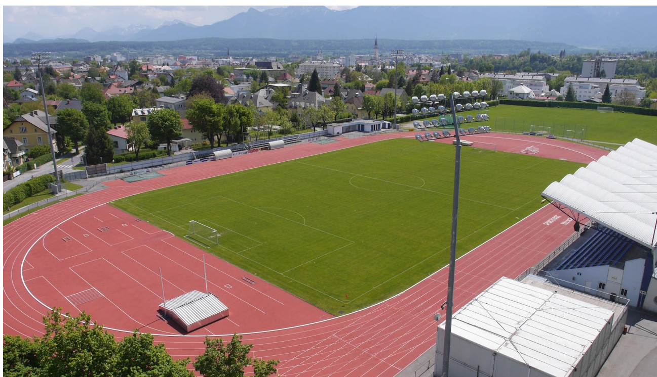
Stadion Lind - Villach